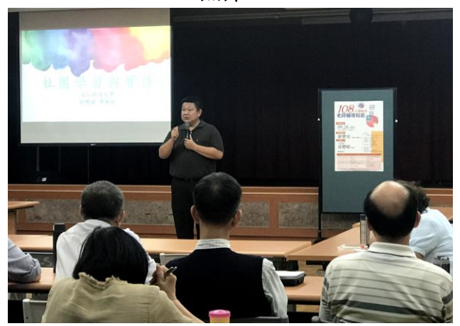
社 團 學 分 化 經 驗 分 享 2