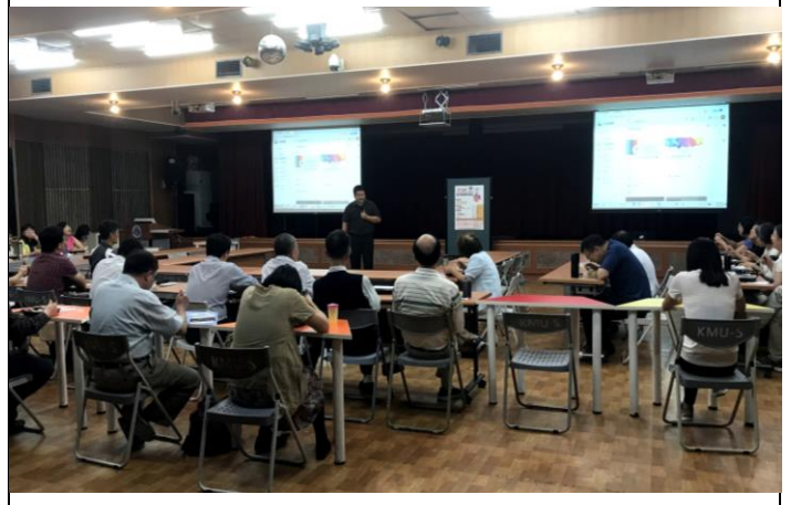
Q & A 時 間