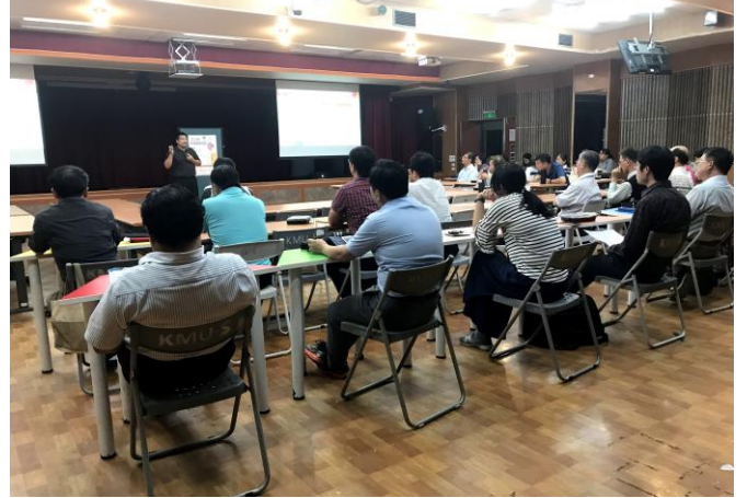
介 紹 時 間