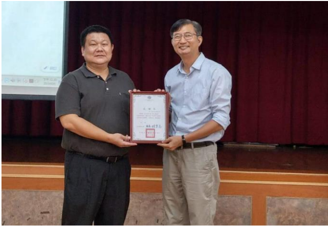
致 贈 感 謝 狀