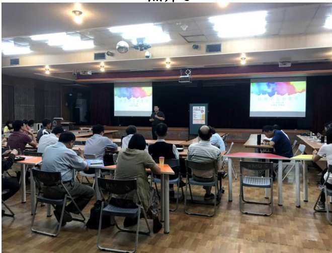
社 團 學 分 化 經 驗 分 享 3